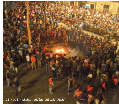
San Juan Jaiak / Fiestas de San Juan