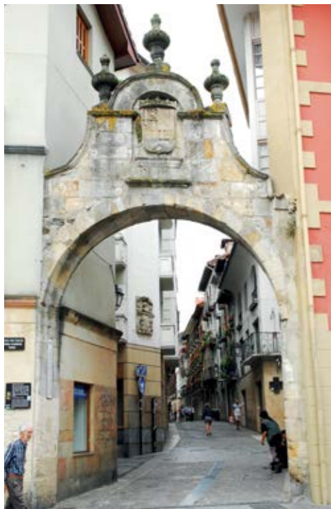
Portaloi / Portalón

Uribarri auzoan daude, batetik, Itxaropena amabirjinaren eliza eta, bestetik, Gorostiza baserria eta Musakolan San Isidrori eskainitako eliza.