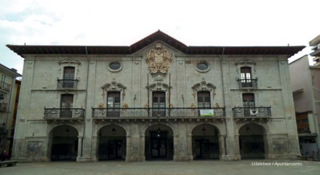
Udaletxea / Ayuntamiento