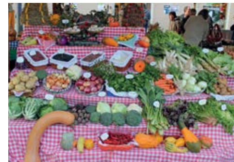
Santamaseko azoka / Mercado de Santo Tomás