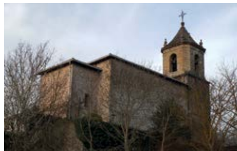
Bedoñako Santa Eulalia Eliza / Iglesia de Santa Eulalia de Bedoña

Por último, destacaremos en el barrio de Uribarri, la iglesia de Nuestra Señora de la Esperanza y el caserío Gorostiza, declarado monumento.