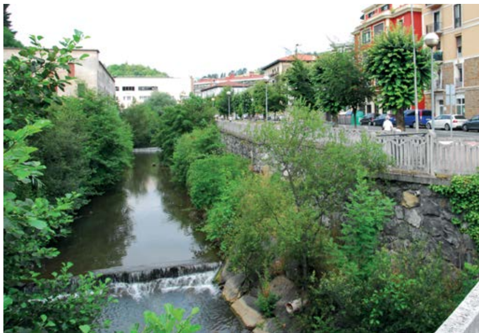
Deba ibaia / Río Deba

Son dos las carreteras importantes que pasan por Arrasate: La autopista Eibar-Gasteiz AP-1 y la autovía Beasain-Durango.