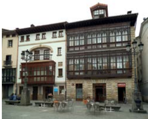
Mendia Etxea eta Andikano- Zelaa Jauregia Casa Mendia y Palacio Andikano-Zelaa