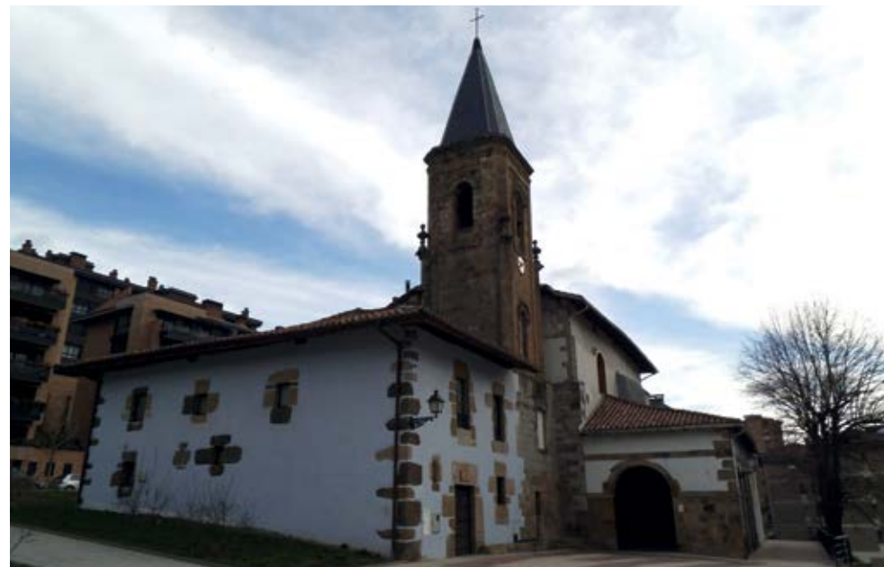
Uribarriko Eliza / Iglesia de Uribarri

Además, existen otras edificaciones de interés en la zona centro de la villa de Arrasate: Edificio de Erdiko kalea 54, con arcos decorados con cuerdas; el palacio de Adan de Yarza, en el nº 9 de Seber Altube plaza, edificio simple decorado con escudo; la casa Garibai, en la calle Arano eta Garcia maisu-maistrak kalea, decorado con el escudo de