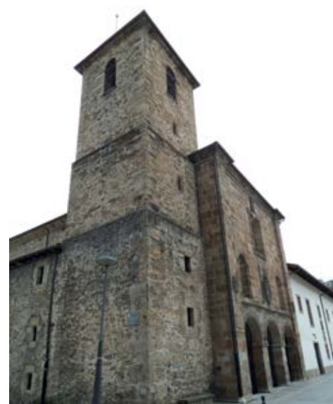
San Frantzisko eliza / Iglesia de San Francisco

Alde zaharra, Eusko Jaurilaritzak monumentu multzo deklaratu zuen 1997an. Hasiera batean harrisez inguratuta zegoen, Goikobalu gazteluaren azpialdean. Gaur egun, hasierako almendra itxurako egitura mantentzen du, baina ez gaztelua ezta harrisia ere. Hiru kalek osatzen dute alde zaharra: Erdiko kalea, Ferrerías eta Iturriotz. Iraganean bost ate bazeuden ere, egun, hiru ate daude. Portalioa da aterik garrantzitsuenak, Maalako errebalaren aurrealdean dago eta bertan batzen dira alde zaharreko hiru kaleak; Zurgin kantoia da zaharrena eta hirugarrena Kanpatorpea.