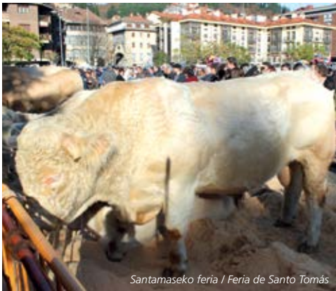
Santamaseko feria / Feria de Santo Tomás