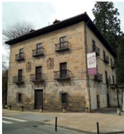
Monterron Jauregia / Palacio de Monterron

gutxiakoa delako. Eraikinean bi armari daude, Barrutia eta Okendotarena. Garrantzitsuena Barrutiaren armarría da, lehenengo solairuan dagoena, etxe honen maiorazkoa Ines de Barrutia Zelaarena izan zelako.