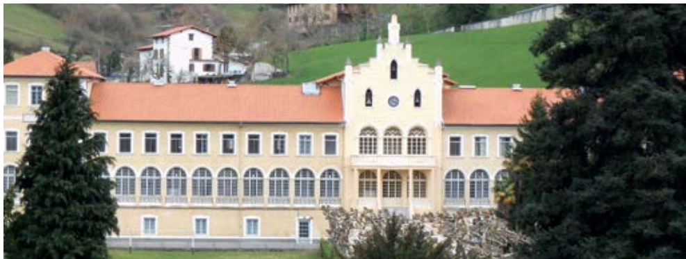
Santa Agedako bainuetxea / Ospitale psikiatrikoa Balneario de Santa Agueda de Gesalibar / Hospital psiquiátrico

En el siglo XXI, Arrasate ha tenido que consolidar y reforzar su industria, para que los productos sigan siendo competitivos en un comercio globalizado.