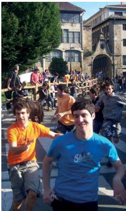
Encierro en San Juan / Sanjuanetako entzierroa