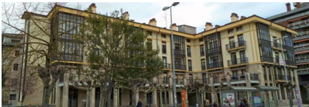
Iturbide egoitza / Residencia Iturbide

■ RESIDENCIA DE ANCIANOS ITURBIDE Garibai kalea 1 ..... 943 252 090