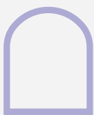
ATEA / ARKUA